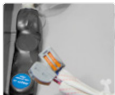
WAGO Klemme für Sensormodule