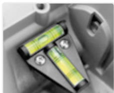
integrierte Libelle für optimale Ausrichtung